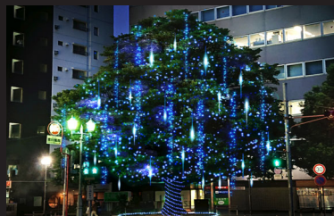
タブノキ広場 ブルーのイルミネーションで飾られたきらびやかなタブノキ。