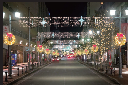
慈光通り・大手前通り 街路灯や街路樹がこの時期限定の特別な空間に様変わり。多彩な色の光のアーチがより華やかな通りを演出。慈光通りの歩道にはマッピングライトにより雪の結晶が映し出される。