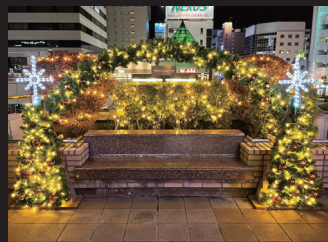
高崎駅西口ペDESTリアンデッキ ペDESTリアンデッキ西口正面にあるベンチが華やかに装飾されフォトスポットに。高崎OPA前には鮮やかな造花で作られた高さ約6mのフラワーツリーと小さなツリーが登場。また市内の保育園・幼稚園・認定こども園の園児たちが作る光のキャンバスも駅前を彩ります。