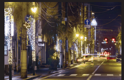
柳通り 本町二丁目まで街路灯に装飾されたイルミネーション。星型のライトのアクセントが通りを彩ります。

ご来場の際は、新型コロナウイルス感染予防へのご協力をお願いいたします。 [お問い合わせ] 高崎光のページェント実行委員会事務局 Tel: 027-330-5333 〒370-0849 高崎市八島町222 高崎モントレー2階 (高崎観光協会内)