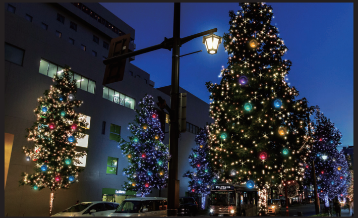
シンフォニーロード 鮮やかなシャンパンゴールドとブルーのイルミネーションが華やかに彩る。