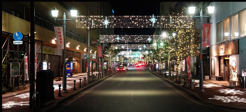
慈光通り・大手前通り

街路灯や街路樹がこの時期限定の特別な空間に様変わり。多彩な色の光のアーチがより華やかな通りを演出。慈光通りの歩道にはマッピングライトにより雪の結晶が映し出される。