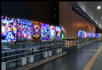
高崎駅西口ペDESTリアンデッキ

鮮やかな造花で作られた高さ約6mのフラワーツリーが登場。また、市内の保育園・幼稚園・認定こども園の園児たちが作る光のキャンパス。