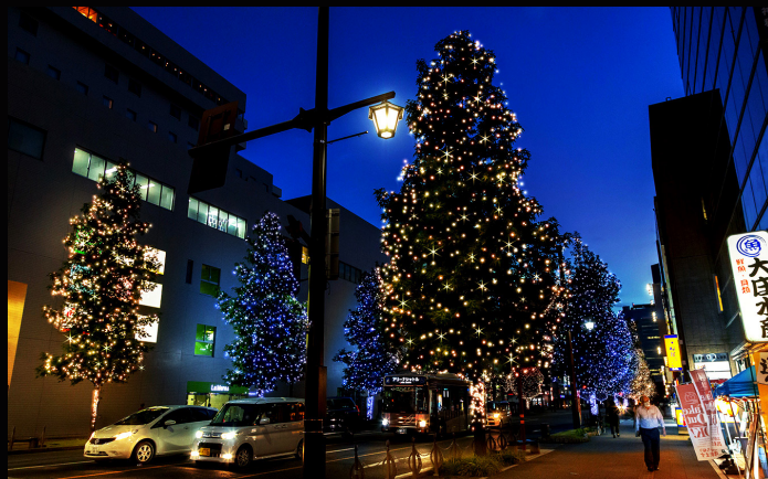
シンフォニーロード

シンフォニーロード、東二条通り、慈光通り・大手前通りでは街路樹などが無数の光で華やかに輝き、幻想的な高崎の冬の街並みを演出。高崎城址公園のお堀には、樹木へのライトアップなどが水面に映し出す幻想的な風景が皆様を出迎えます。また、今年から高崎駅西口ペDESTリアンデッキには、高さ約6メートルのフラワーツリーが登場。恒例の子ども達の制作する光のキャンパスも場所を移動。さらに今年はさやもーる、南銀座通り、柳通りまで会場を拡大。街中を周遊しながら、特別な空間をぜひお楽しみください。