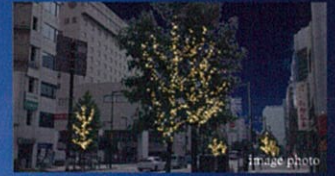
シンフォニーロード