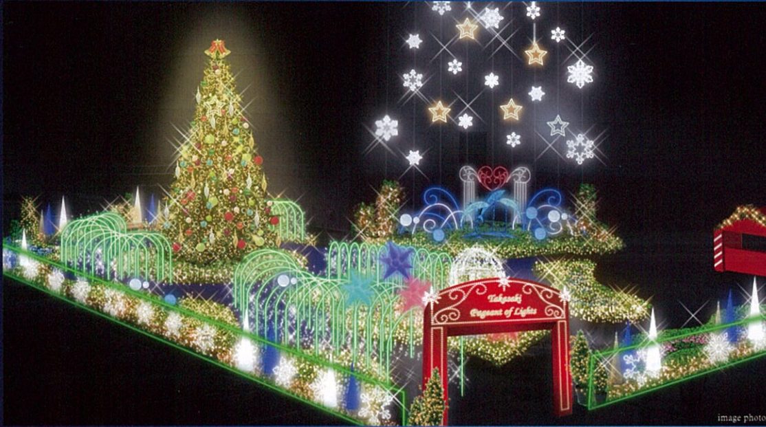
高崎駅前西口「光のページェント」特設会場